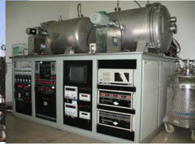
谐波减速器台架试验装置