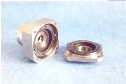
固体润滑谐波减速器